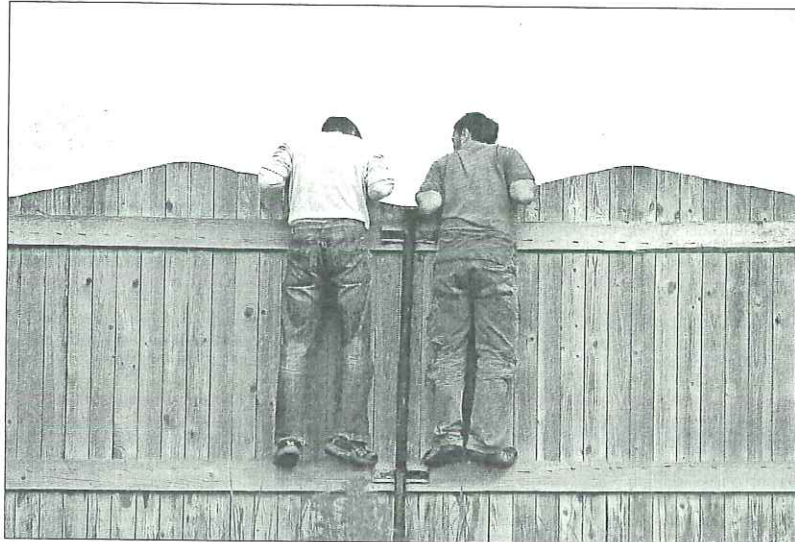
Kritischer Blick über den Zaun: Die Luxemburger sehen sich ihre Nachbarn weitaus genauer an, als dies noch vor zehn Jahren der Fall war. Wer von der Norm abweicht oder wer anders ist, wird zunehmend abgelehnt.

So wurden die Teilnehmer gefragt, welche Gruppe von Menschen sie nicht als Nachbarn haben möchten. Am unbeliebtesten sind Drogenabhängige, sprachen sich doch 55 Prozent der Befragten gegen einen Süchtigen als Nachbarn aus. 1999 lehnten erst 43 Prozent die Abhängigen als Nachbarn ab. Unerwünscht sind auch Rechtsextremisten. Die Hälfte der Befragten lehnten sie als Nachbarn ab, gegenüber 57 Prozent im Jahr 1999. Linksextremisten sind nicht ganz so unerwünscht. 38 Prozent der Bevölkerung möchten nicht Tür an Tür mit einem Linksextremisten wohnen, vor zehn Jahren war die Ablehnung mit 42 Prozent noch etwas größer. Der politische Extremismus ist übrigens die einzige Kategorie, in der die Ablehnung in der vergangenen Dekade leicht rückläufig war.